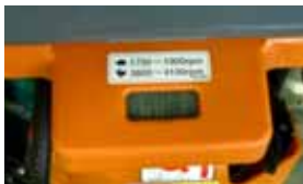
タコアワーメーター

MT-55L-SGK は、 防音カバー・大型消音マフラー・ ウレタンフートの採用により 転圧作業の低騒音化を図るとともに 手腕振動の軽減、タコアワーメーターによる 作業時間及びメンテナンス時間の管理を 可能にしました。